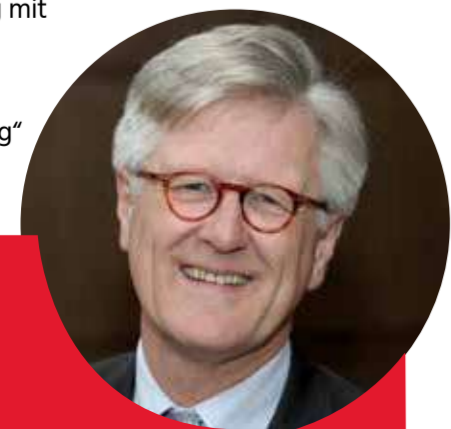
Heinrich Bedford-Strohm Sonntag, 13:00h, Fronwagplatz