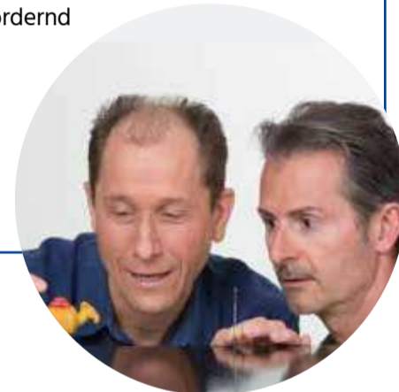
Öpäsö Samstag, 20:00h, Haberhaus